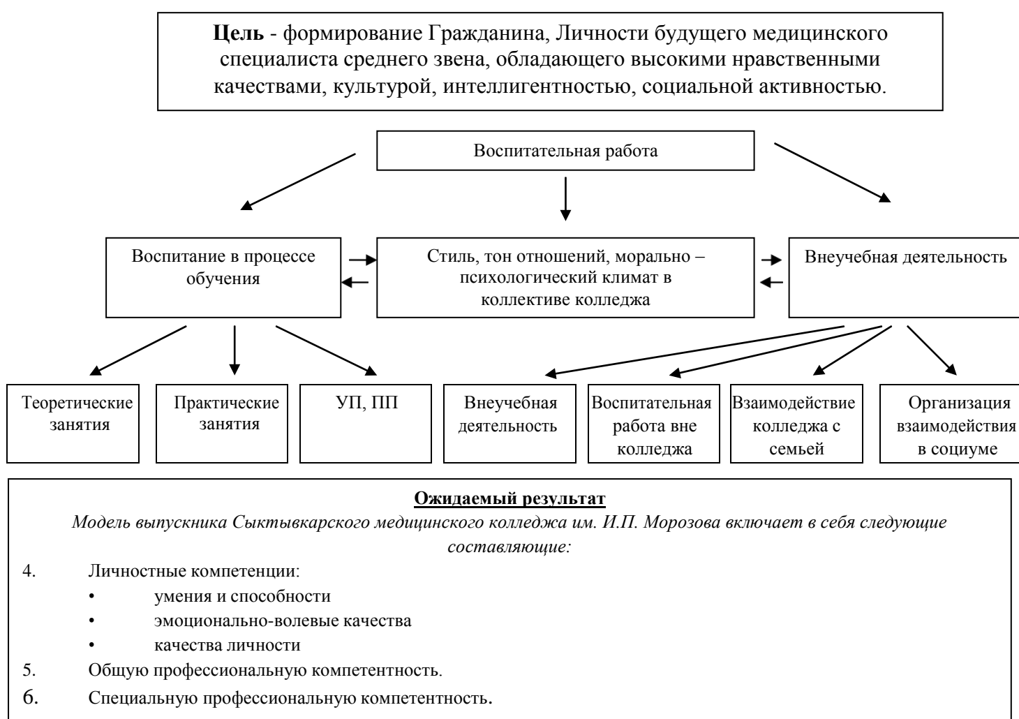
Рис. Система воспитательной деятельности Колледжа

Систему воспитательной деятельности в Колледже можно представить в виде взаимосвязанных блоков.